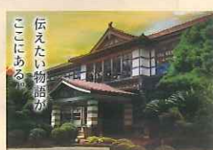
伝えたい物語が ここにある