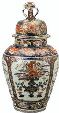
色絵花盆文蓋付大壺 肥前 有田 江戸時代中期(18世紀初頭～中頃)