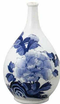
染付牡丹文德利 肥前 鍋島藩窯 江戸時代後期(19世紀前半～後半)