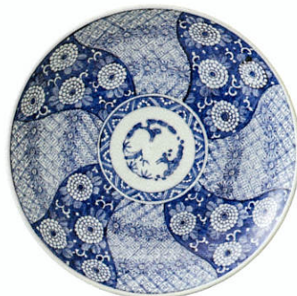
染付松竹梅菊珍花文大皿 肥前 有田 江戸時代後期(19世紀初頭～中頃)