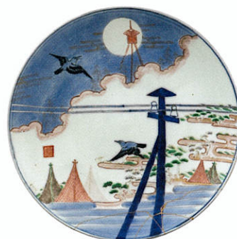
色絵電線図大皿 佐賀 有田(瀬戸口富右衛門) 明治時代(19世紀後半～20世紀初頭)