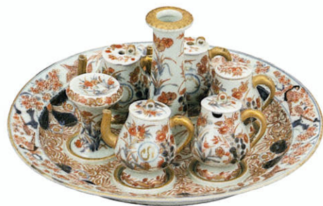
色絵色絵花鳥文調味料入揃物(7点組) 肥前 有田 江戸時代中期(18世紀初頭～中頃)