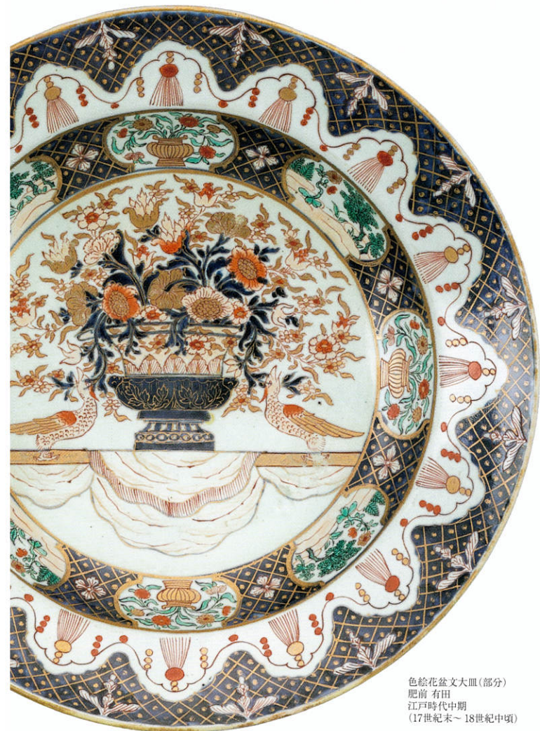
色絵花盆文大皿(部分) 肥前 有田 江戸時代中期 (17世紀末～18世紀中頃)

The Akagi Collection from The Museum of Ceramic Art, Hyogo. Ko-Imari Adapting to the Times - The Splendid World of Porcelain.