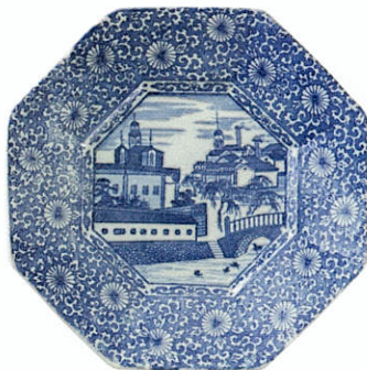
染付造幣局八角皿 岐阜 美濃 明治時代～大正時代(19世紀後半～20世紀前半)